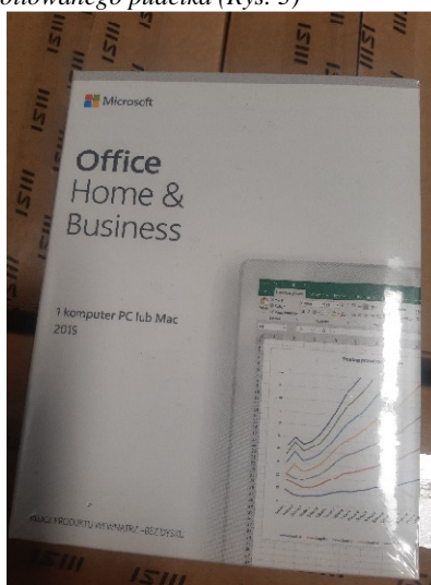
Rys. 3 Przykładowe zdjęcie pudełka dla produktu Microsoft Home&Business

Jesteśmy przekonani , że dzięki takiemu zapisowi do wzoru umowy Zamawiający otrzyma od potencjalnego Wykonawcy w pełni oryginalne oprogramowanie zgodne z warunkami licencjonowania producenta oprogramowania.