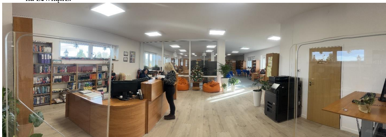
Fot.1 Biblioteczne Centrum Obsługi